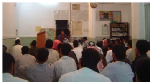
対象コミュニティの住民とのタウンミーティング

IOMはこのプログラムを通じ、全体で11,600人を支援することを目指しています。