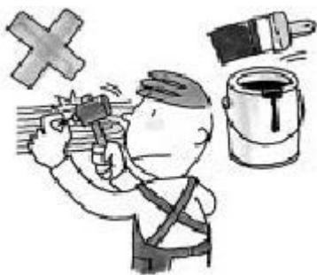
Clavar en la pared o pintar

Sin permiso del propietario, no haga reforma o cambio de la decoración del interior o no deje vivir juntos a las personas que no sean miembros de su familia. Desde luego, no debe alquilar una parte o total de la vivienda a otras personas.