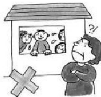
Alquilar la vivienda a otras personas