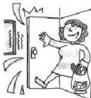
Sonido de abrir y cerrar la puerta con fuerza