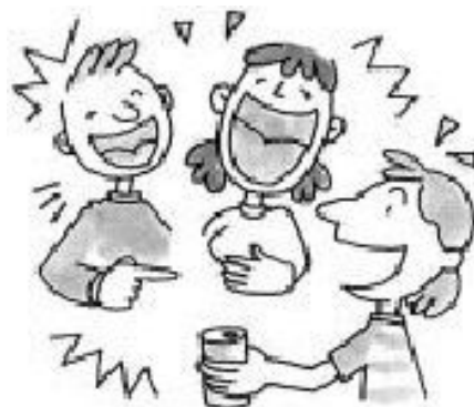
Vozes altas e som de música alto na festa