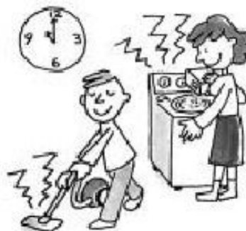
Ruído do aspirador e da máquina de lavar